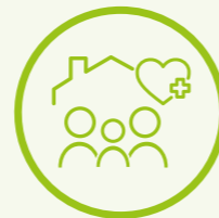
Gesundheitsförderung in Bildungseinrichtungen