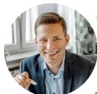
MS St. Gilgen/Sabine Holzer

„Unsere Schule lebt Bewegung und Entspannung: Mit Pausenraumberatung und SchiLf „Bewegtes Lernen“ gestalten wir den Alltag aktiv, verlängern die Pausen und schaffen Indoor- und Outdoor-Zonen mit Spiel- und Bewegungsmaterial. Zudem bieten wir die erste Pause als bewegte Pause in Turnsaal oder Schulhof und die zweite Pause als entspannte Pause mit Büchern, Puzzles und Spielen an.“